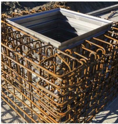
Utilisation de la réservation TBA