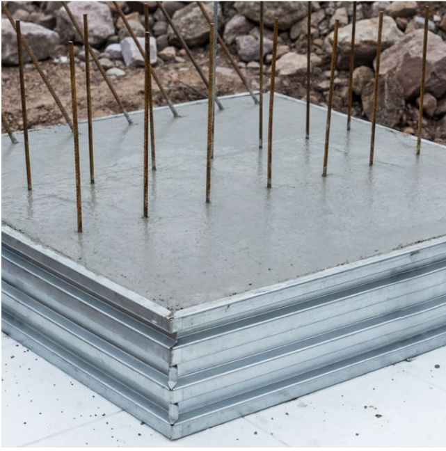
Réservation TBA comme coffrage extérieur