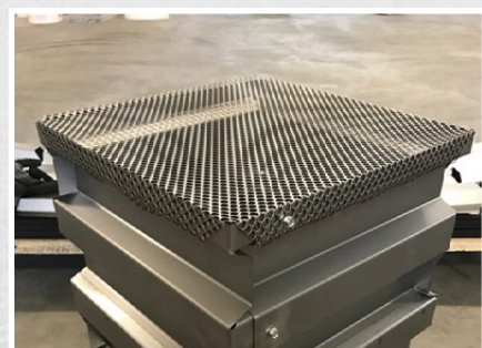
Tôles de fond en métal déployé disponibles

Mägert G&C Bautechnik www.mbt-bautechnik.com info@mbt-bautechnik.com +41 (0)41 610 85 53