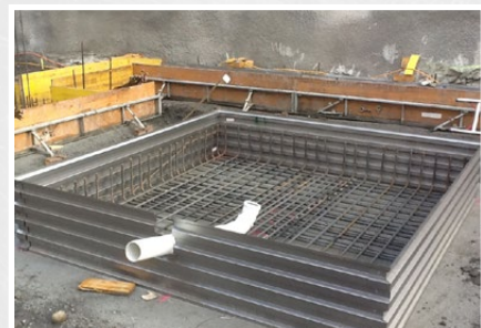
Réalisation aisée de grandes réservations avec perforations