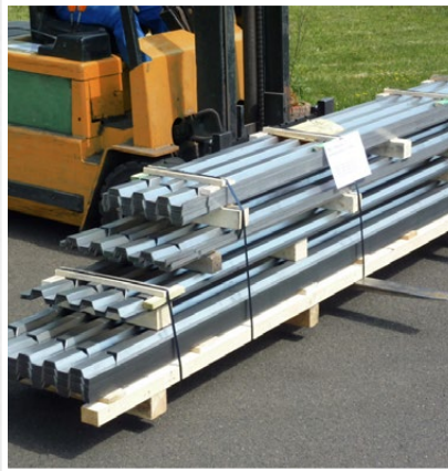
Transport aisé des tôles trapézoïdales