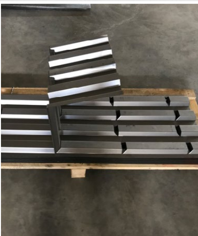
Pliage aisé grâce au point de pliage