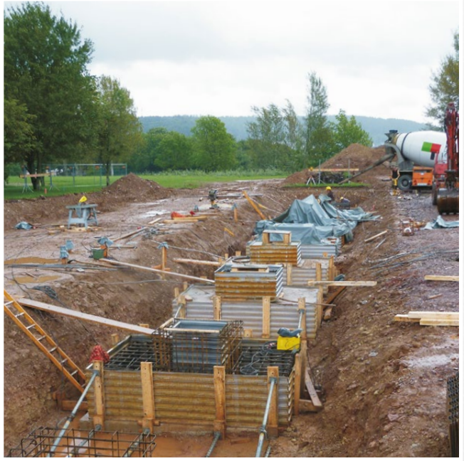
Réservation TBA comme coffrage intérieur et extérieur