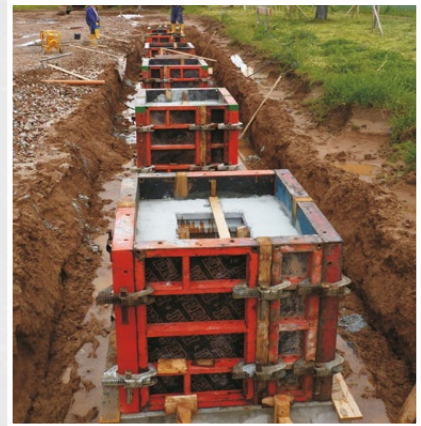
Réservation TBA bétonnée