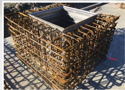
Utilisation de la réservation TBA