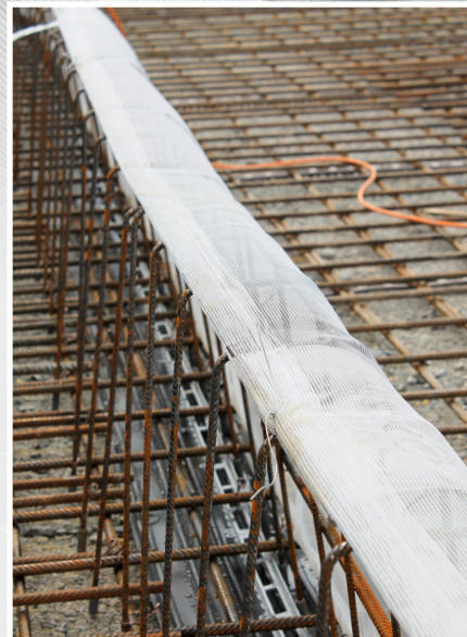
Le Roll-Net au-dessus de la cage d'écartement

Plus de photos, informations et mode d'emploi à l'adresse www.mbt.swiss/111