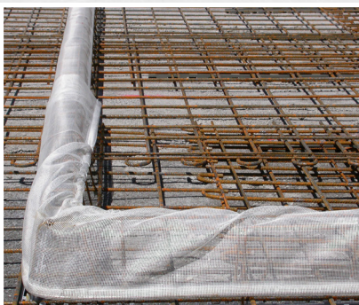
Le Roll-Net se déforme librement