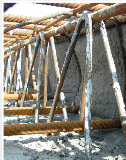
Une solution parfaite!