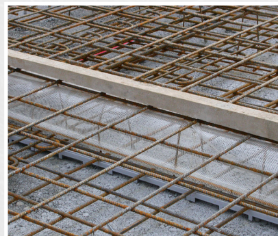
Pose de l'armature supérieure et fixation d'une planche de bordure