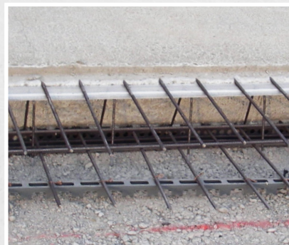
Le Roll-Net après la procédure de bétonnage