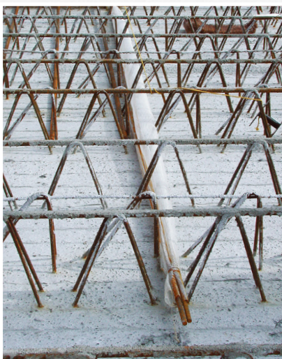
Coffrage dans le sens transversal pour l'armature des éléments.