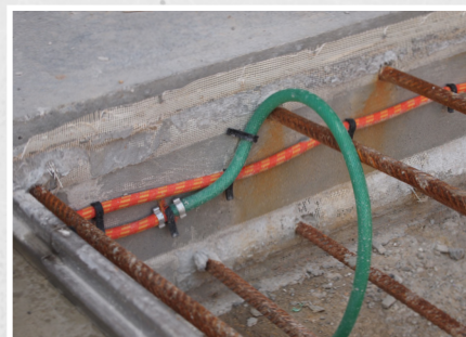
Roll-Net peut également être utilisé en combinaison avec des tuyaux à injection