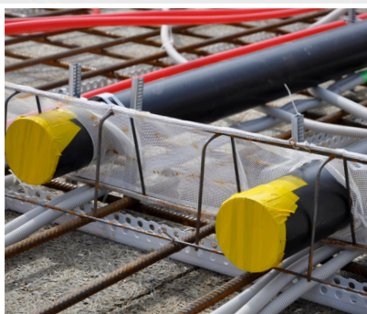
Pour intégrer diverses installations (par ex. des tuyaux), incisez simplement une croix, faites passer l'installation, puis collez les languettes du treillis sur l'installation à l'aide d'un ruban adhésif pour béton.