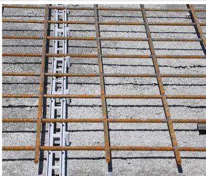
Pose des rails et de l'armature