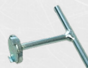
Dispositif d'aide au dévissage pour le cône magnétique