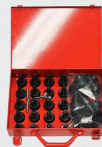
Ensemble de cônes magnétiques DW 15