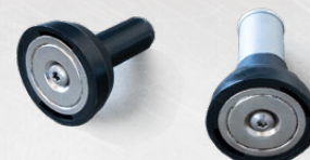
Cône magnétique 15 mm & 20 mm

Plus de photos, informations et mode d'emploi à l'adresse www.mbt.swiss/162