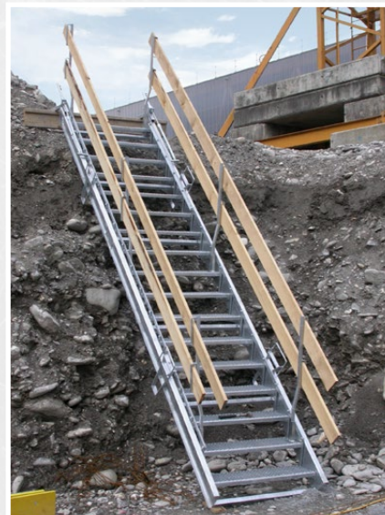
Sky-Step de 5 m utilisé