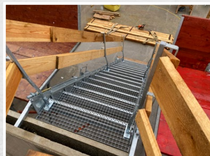
Accès sécurisé au chantier avec Sky-Step