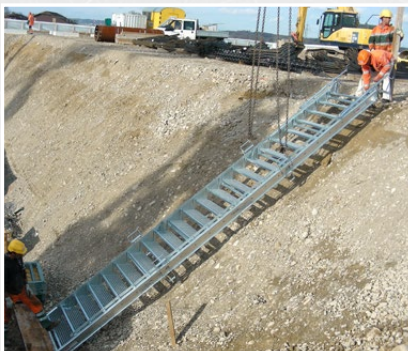
L'escalier de fouille au montage