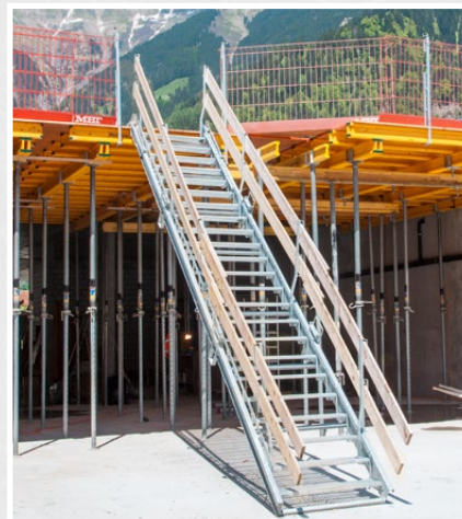
Accès au chantier avec Sky-Step de 7 m