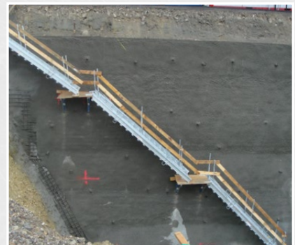
L'escalier de fouille combiné avec des plateformes intermédiaires