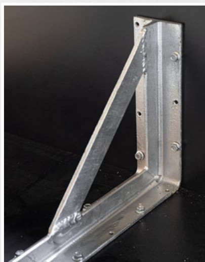
Équerre de coffrage fixée avec des vis à tête hexagonale