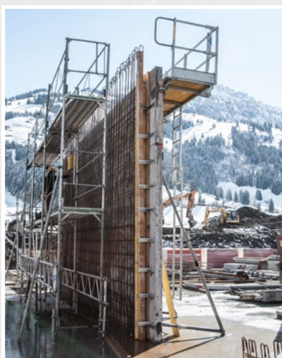
Les équerres de coffrage conviennent parfaitement à une utilisation avec des coffrages muraux