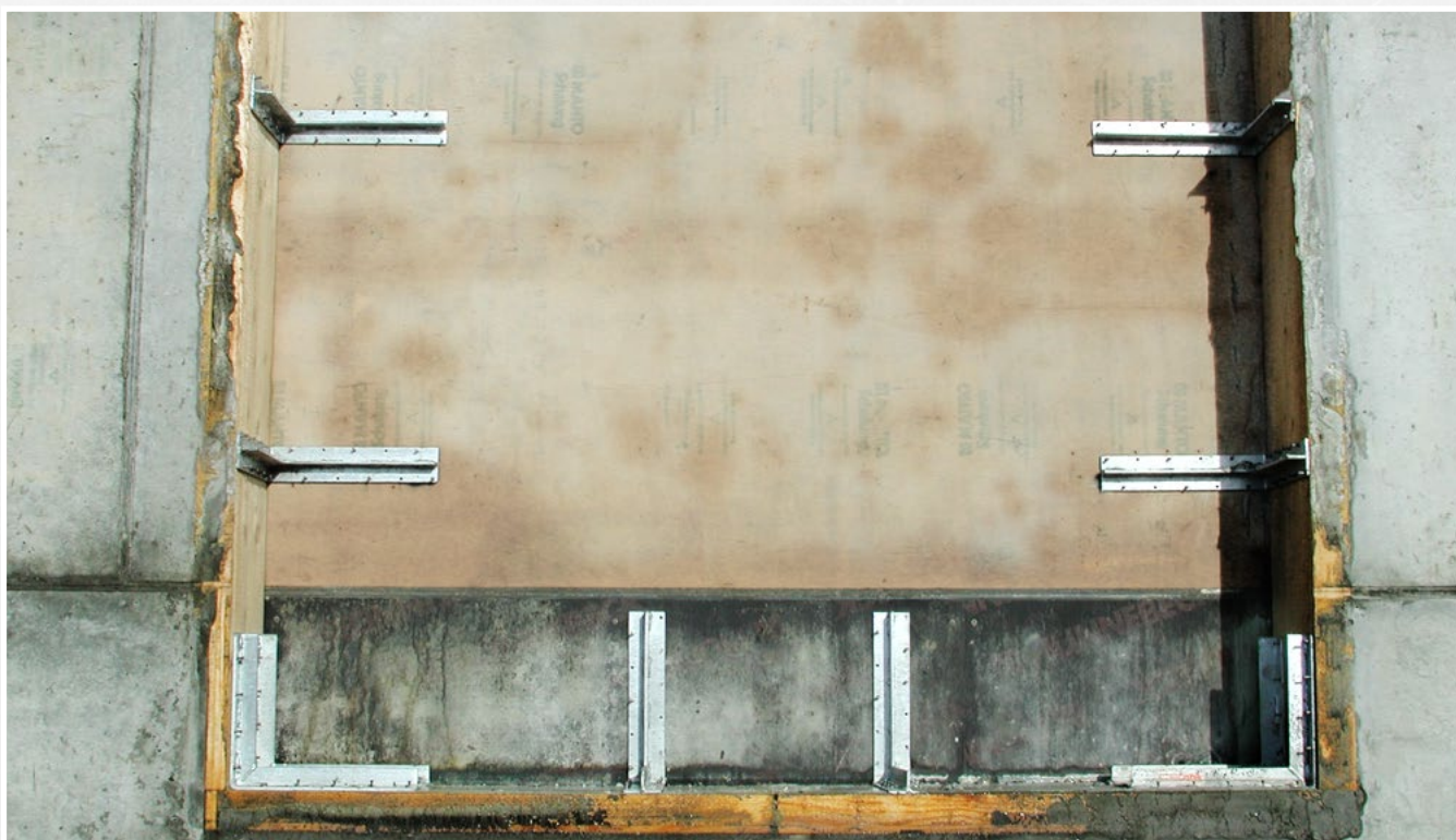
L'équerre de coffrage convient aux évidements de tous types