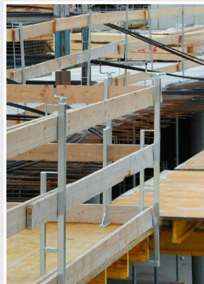
Étançon à manivelle avec angle