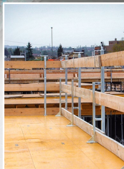
Étauçon à manivelle de 1,06 m

Plus de photos, informations et mode d'emploi à l'adresse www.mbt.swiss/127