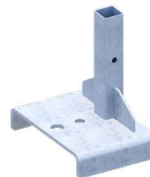
Adaptateur pour système de retenue de véhicule type New Jersey

Plus de photos, informations et mode d'emploi à l'adresse www.mbt.swiss/238