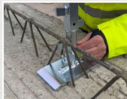
Pour un serrage sûr entre la poutrelle treillis et le coffrage de dalle avec une plage de serrage de 8 à 33 cm.