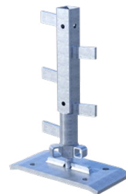
Adaptateur de prédalle pour montant de barrière MBT

Plus de photos, informations et mode d'emploi à l'adresse www.mbt.swiss/239