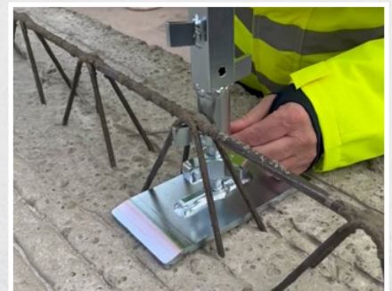
Zum sicheren Einspannen zwischen Gitterträger und Deckenschale mit einem Spannbereich von 8 bis 33 cm.