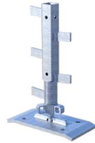
Elementdecken-Adapter für MBT-Steckpfosten

Weitere Fotos, Infos und Bedienungsanleitung unter www.mbt.swiss/239