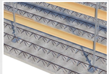
... oder konventionell mit Holz