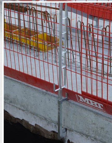
Adaptateur BKA Pro avec dispositif de protection latérale Safe-Gard