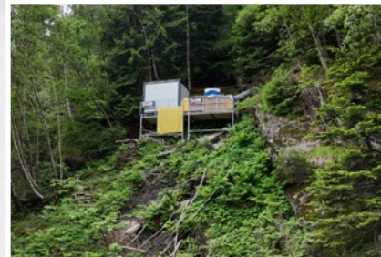
Die Hangbühne 3500 ist die optimale Lösung in abschüssigem Gelände

Weitere Fotos, Infos und Bedienungsanleitung unter www.mbt.swiss/228