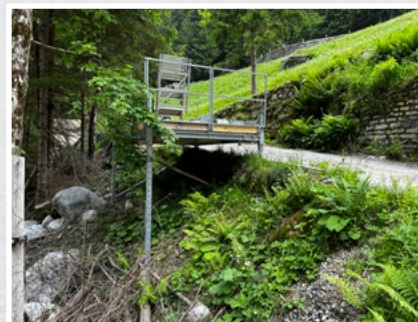
Montierte Hangbühne mit Stützenverlängerung