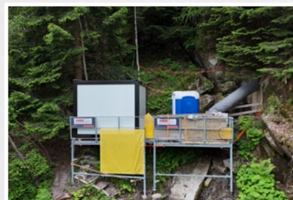
Sie bietet eine sichere Arbeits- und Lagerplattform