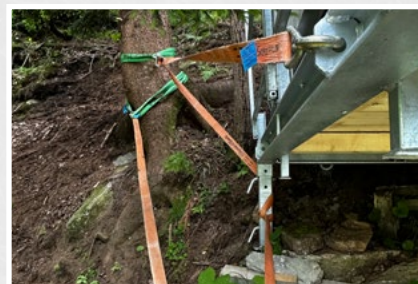
Zahlreiche Anschlagpunkte ermöglichen eine sichere Rückverankerung