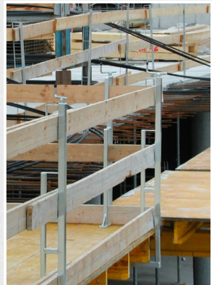
Kurbelpfosten mit Eckausbildung