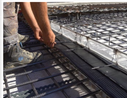
...und zeitsparend versetzen