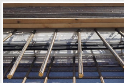
Klapp-Form fertig montiert