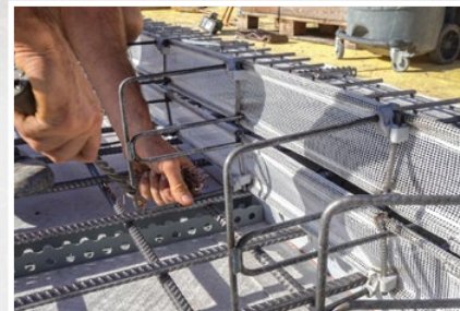
Klapp-Form lässt sich einfach aufklappen...

Weitere Fotos, Infos und Bedienungsanleitung unter www.mbt.swiss/224