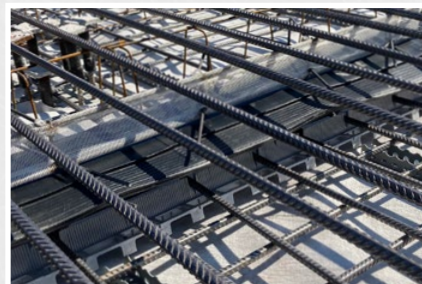
Anschliessend Fugenbänder/Bleche einfach einführen und obere Armierung auflegen