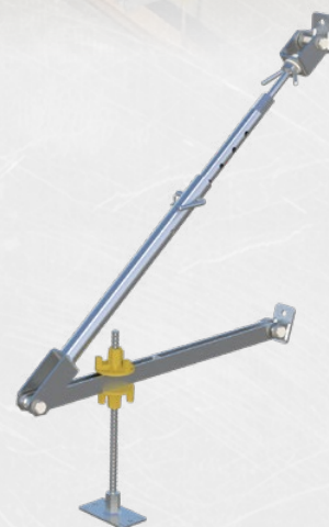
Robust und einstellbar