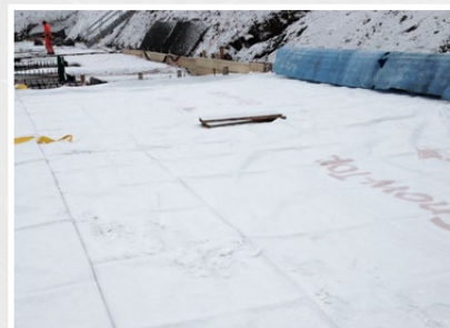
Grosse Bereiche können mit mehreren Snow-Top's abgedeckt werden