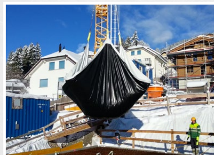
Schnee mit der Snow-Top Blache anheben