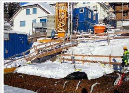
Snow-Top an den Kran anhängen

Weitere Fotos, Infos und Bedienungsanleitung unter www.mbt.swiss/176