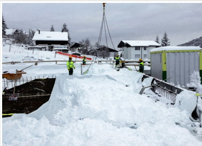
Einfaches und schnelles Schneeräumen auf der Baustelle