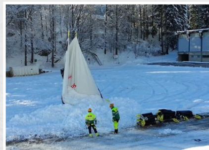
Snow-Top Blache entleeren