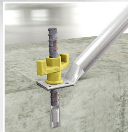
Schlagdübel DW 15 mm im Einsatz

Weitere Fotos, Infos und Bedienungsanleitung unter www.mbt.swiss/141