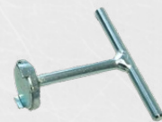
Ausschraubhilfe für Magnetkonus