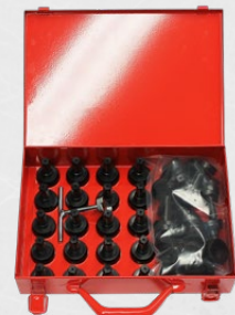
Magnetkonus-Set DW 15 mm