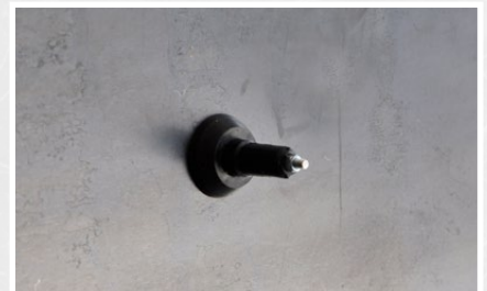
Magnetkonus befestigt an der Stahlschalung