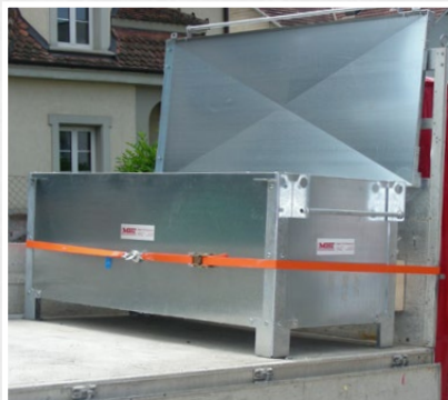
Securi-Transportbox auf Lieferwagen