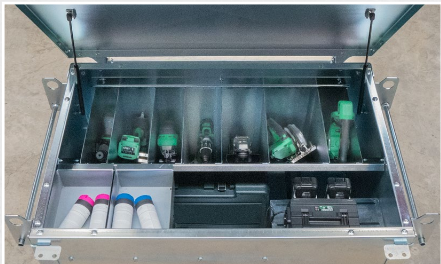
Securi-Elektrobox im Einsatz mit Ladestationen und Elektrowerkzeug