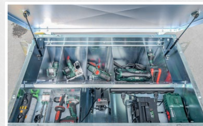
Securi-Elektrobox gefüllt mit Elektrowerkzeug, Ladestationen & einer Heizung