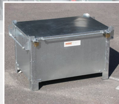
Securi-Box gesichert mit Vorhängeschloss

Weitere Fotos, Infos und Bedienungsanleitung unter www.mbt.swiss/135