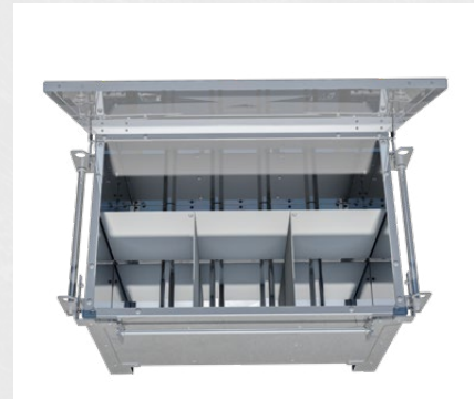
Securi-Kranbox mit vier Unterteilungen